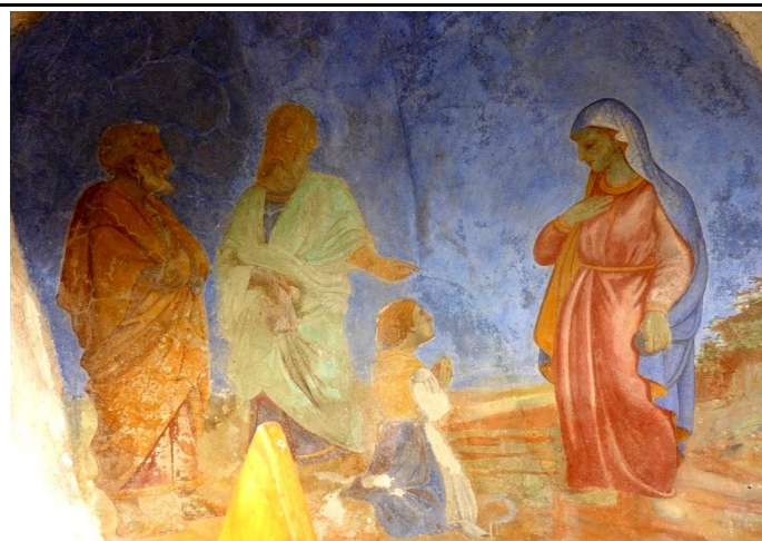
Link particolare manufatto